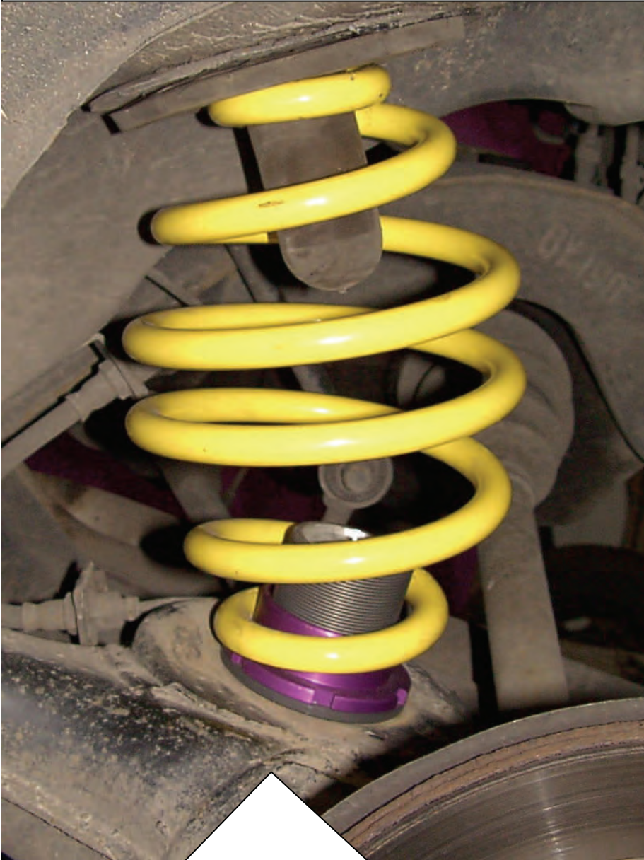
Abbildung nur beispielhaft / Example only

Die Höhenverstellung wird, wie im Bild zu sehen, unten (Achsseitig) eingesetzt, wobei die Berührungsfleichen vor dem Einbau gereinigt werden müssen. Die obere Federunterlage mit Anschlagpuffer wird wie beim Seriefahrzeug eingesetzt und sollte sich in einwandfreiem Zustand befinden, ggf. gegen Neuteil ersetzen. Der Einbau des angelieferten Hinterachsdämpfers erfolgt gemäß der Einbauanleitung des Fahrzeugherstellers.