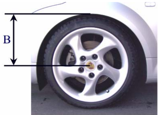
Measurement B Wheel hub center wheel arch

Please enter the adjusted height of the modified car into the list: