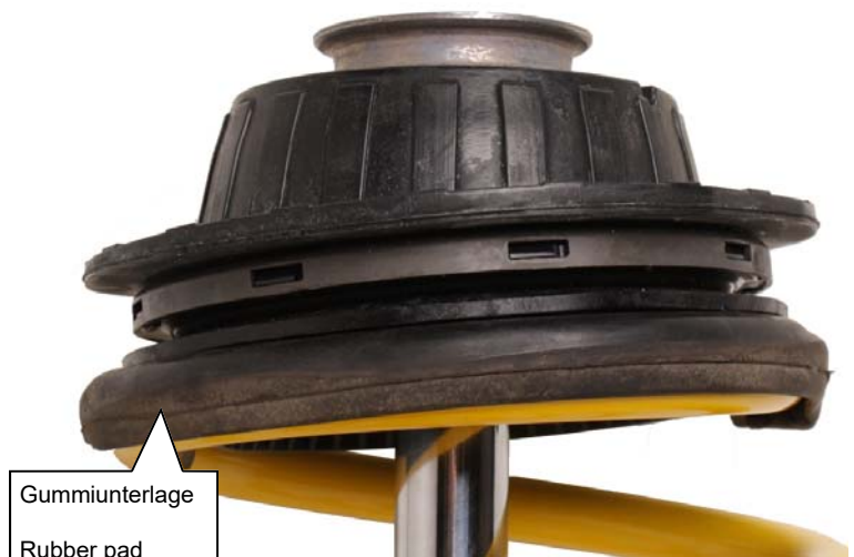
Gummiunterlage Rubber pad

After you have completed installation of the suspension, check the clearance of the tire to the front suspension strut. The minimum clearance at the narrowest point is 5 mm and must, where necessary, be provided using commercially available, Technical Inspectorate approved spacers.